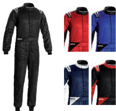
001092..NR 001092..BELNR 001092..NRRS 001092..RSNR 001092..BMBI