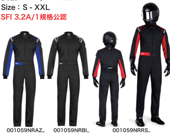
001059NRAZ.. 001059NRBI.. 001059NRRS..