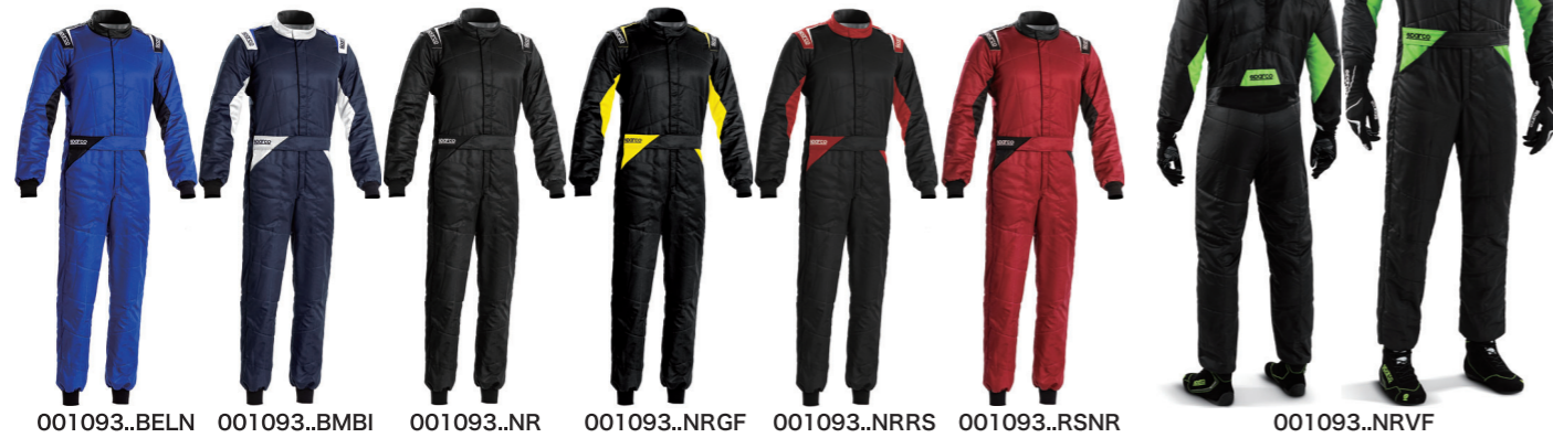
001093..BELN 001093..BMBI 001093..NR 001093..NRGF 001093..NRRS 001093..RSNR 001093..NRVF