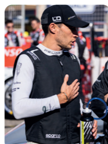
カスタム対応モデル